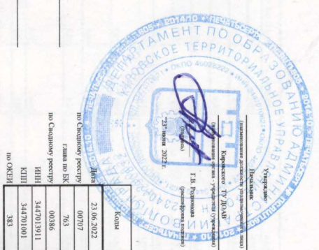
Приложение 1. Поступления и выплаты